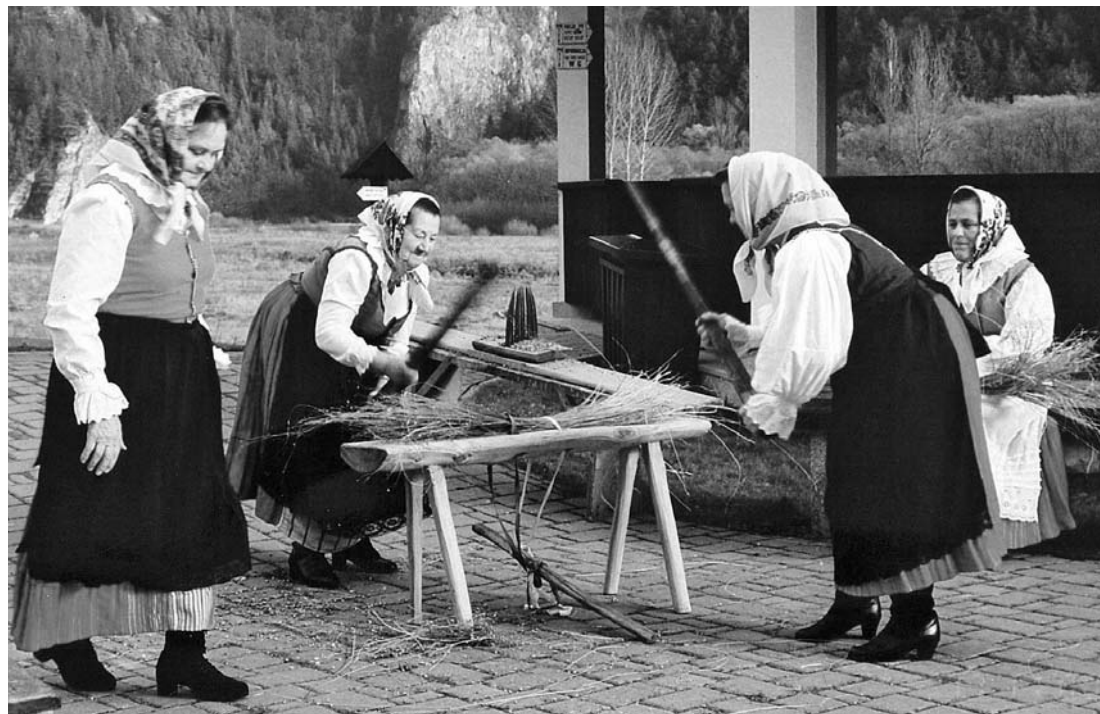
Fot. 2. „Jak to ze lnem było...” – prezentacja dawnych technik pozyskiwania ziarna i włókna lnu. Presentation of old methods for threshing, retting and dressing the flax.