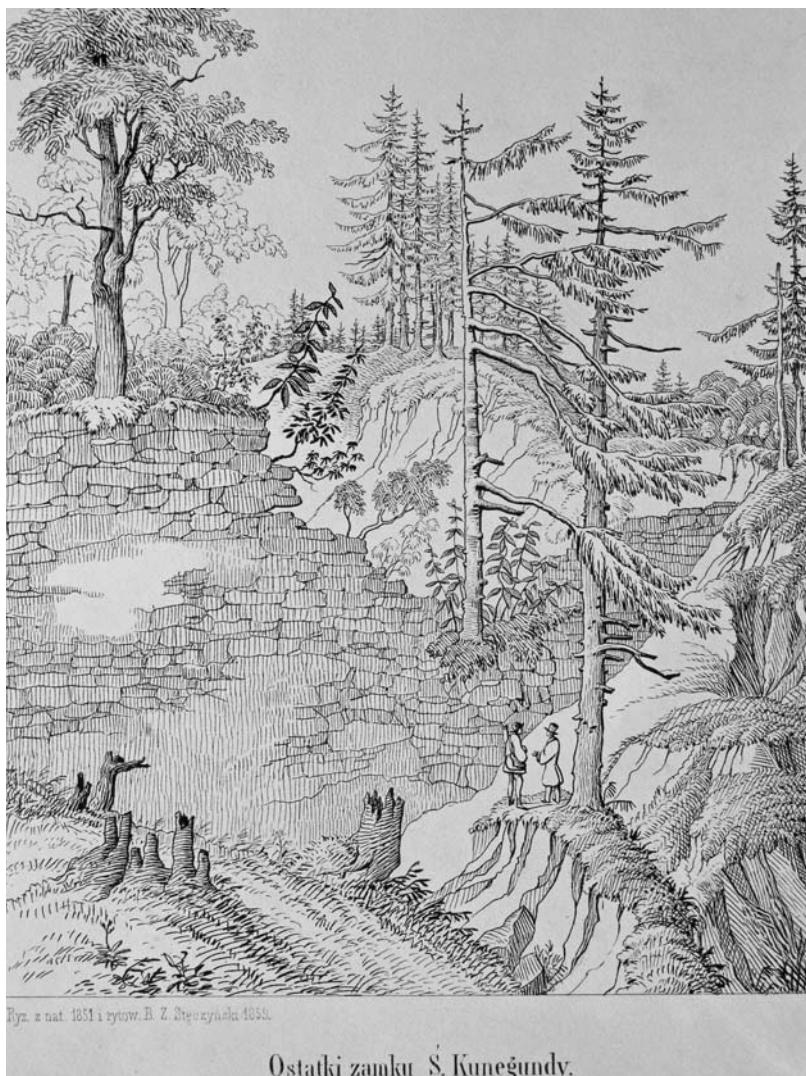
Fot. 4. Litografia „Ostatki Zamku św. Kunegundy”, autor Bogusz Zygmunt Stęczyński. Lithography “The remains of St. Kunegunda castle”, by Bogusz Stęczyński.