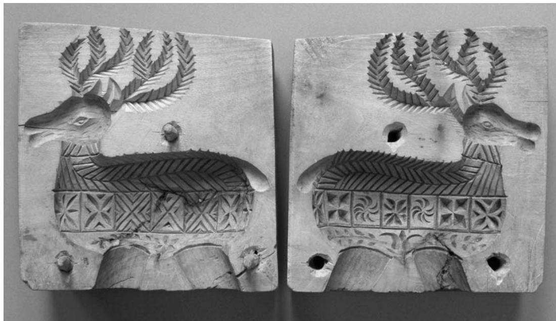
Fot. 1. Dwuczęściowa forma na ser z odciskiem w kształcie jelenia. Two-piece mould with deer ornament to shape cheese into a traditional form.