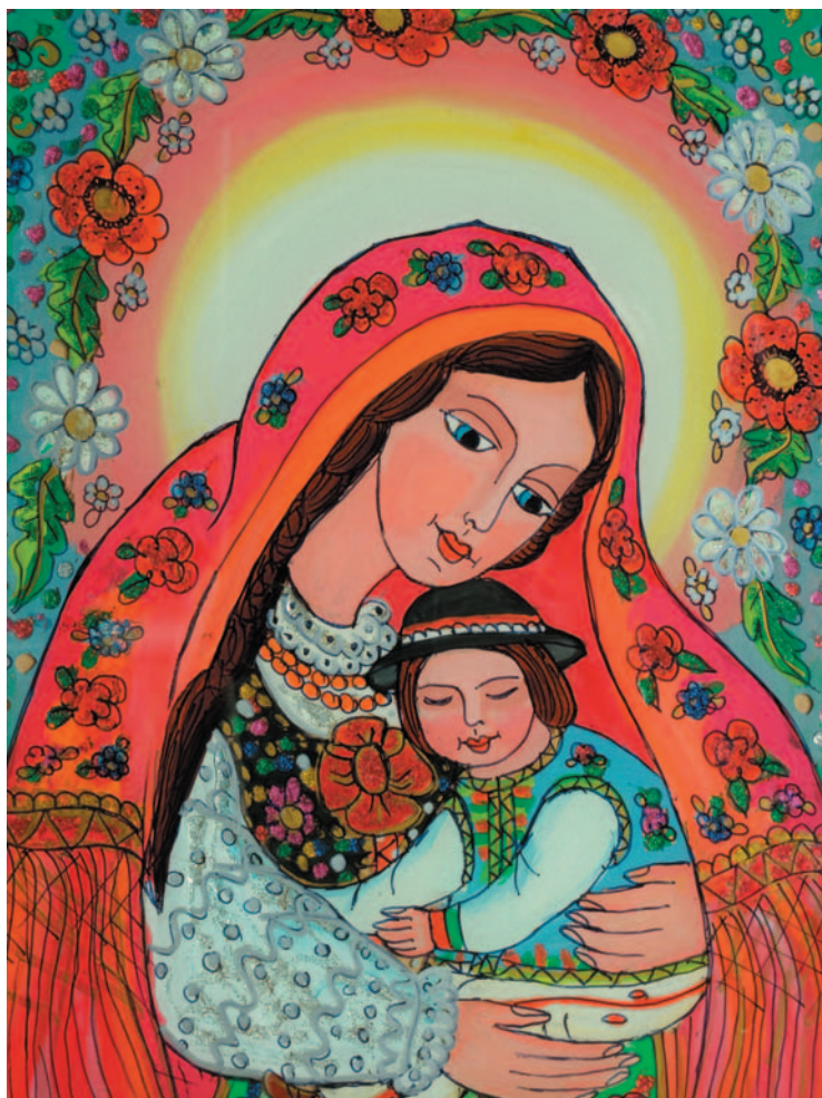
Fot. 6. Obraz na szkle „Madonna Pienińska”, autor Anna Madeja – twórczyni ludowa ze Szczawnicy. Glass painting “The Madonna of the Pieniny” by Anna Madeja – local artist from Szczawnica.