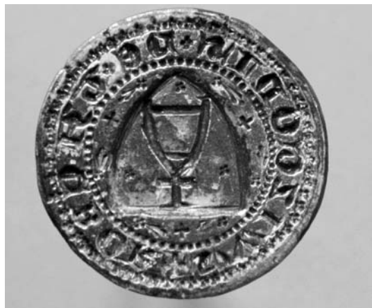
Fot. 3. Pieczęć z brązu pochodząca z wykopalisk na zamku w Czorsztynie. The bronze stamp, found during the excavation works at Czorsztyn castle.